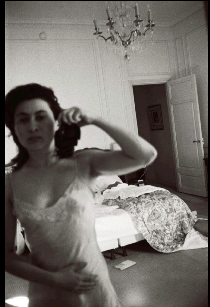
Page de droite : • Instinct sentimental , décembre 2000