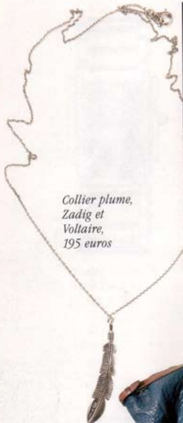
Collier plume, Zadig et Voltaire, 195 euros