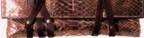
Pochette, Joss, Jérôme Dreyfuss, env. 964 fr.