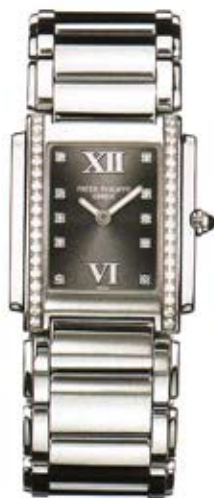
Montre, Twenty~4, Patek Philippe, 10'500 fr.

Trophée, Tête de mort par Big Game, 70 fr.