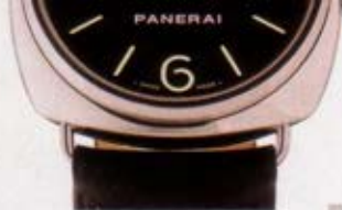
Montre, Radiomir, Panerai, environ 5'000 fr.