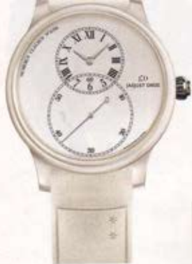
Montre Grande Seconde en céramique blanche, Jaquet Droz, 19'000 fr.