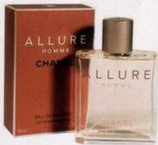
Parfum, «Allure Homme», Chanel, 100 ml, 116 fr.