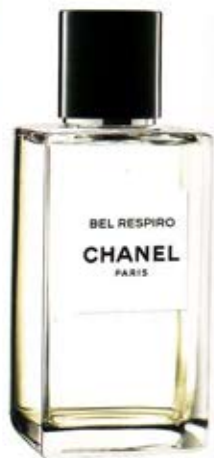
Eau de toilette, Bel Respiro, Chanel, Les Exclusifs, 320 fr.