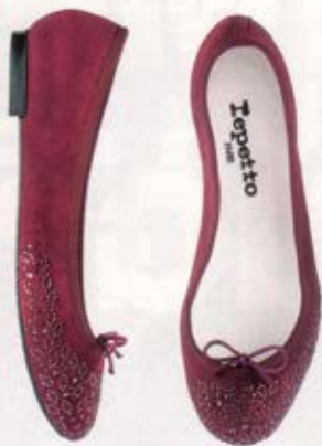
Ballerines, BB Arabesque Nectar, Repetto, 550 fr.