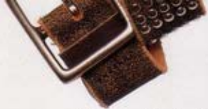
Ceinture, Martinica, 198 fr.