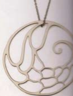
Collier Nessa, pendentif My Angel, env. 720 fr.