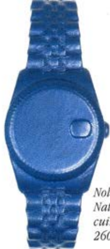
Nolex de Natalia Brill cuir d'agneau 260 euros