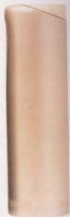
Parfum «Elle», Emporio Armani,