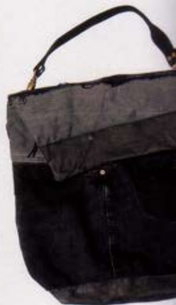
Sac Messenger Hoback, Matières à Réflexion, 4