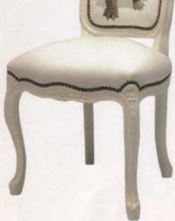
Chaise Louis XV, Téo Jasmin, 506 euros