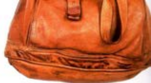
Sac, Odéon, n.d.c., 575 euros