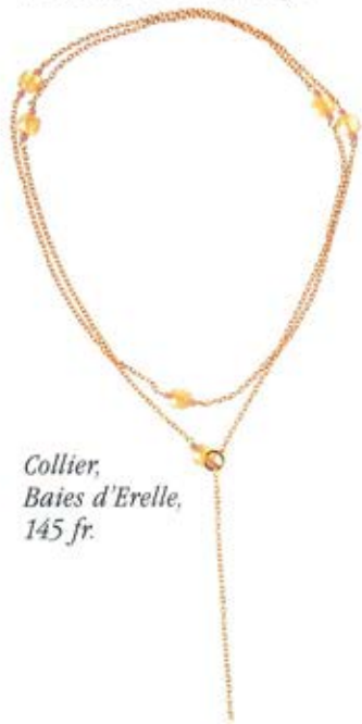
Collier, Baies d'Erelle, 145 fr.