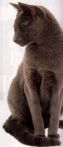
Chat bleu, un chartrre