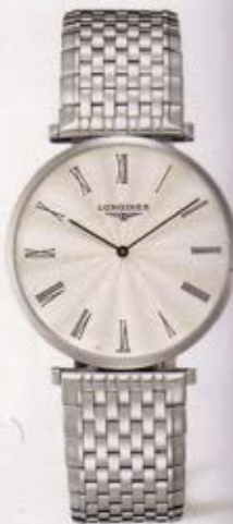
Montre, La Grande Classique, Longines, 1'100 fr.